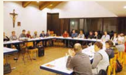
Bericht und Foto: Andreas Weiß

Bei den Rückblicken äußerten sich die Teilnehmer der Konferenz besonders bewegt vom „Tag des geweihten Lebens“ im Januar, bei dem die Priorin des Karmelitenklosters in Wemding Sr. Evamaria Heigl zu einer tiefen und dennoch heiteren Diskussion im Anschluss des Gottesdienstes angeregt hatte.